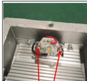
Figure 3 Remove the screws